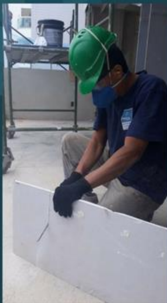
Corte de placas com o uso do serrote

4. Nesta hora o servente o auxilia no corte das placas que serão colocadas nos “cantos” do teto, que necessitam ser serradas para que caibam nos cantos do teto. Estes cortes são feitos com o uso do serrote;